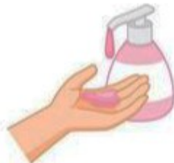
Prenez du savon