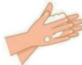
Frottez les paumes