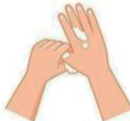
Frottez la base des pouces