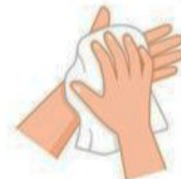
Séchez avec une serviette jetable

Le participant est convié à apporter son savon personnel ainsi que des serviettes en papier jetables.