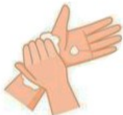
Savonnez vos poignets