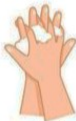
Lavez le dessus des mains