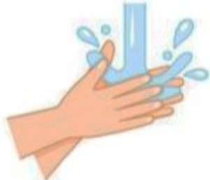
Mouillez vos mains

Privilégier le savon et l'eau . Sans eau, utiliser du gel hydroalcoolique .