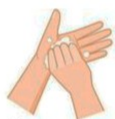
Frottez vos ongles