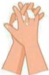
Savonnez entre les doigts